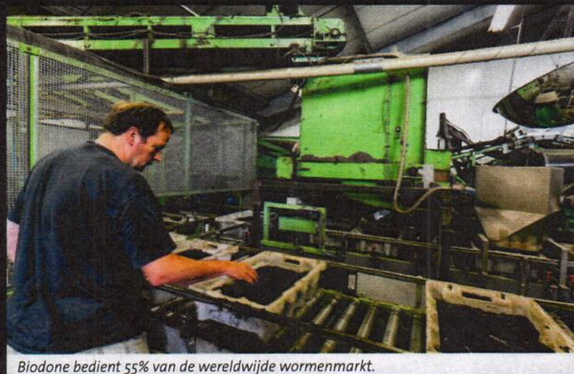
Biodone bedient 55% van de wereldwijde wormenmarkt.