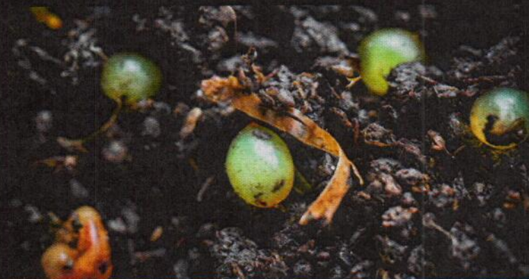
De eitjes komen na vijf tot zes weken uit.