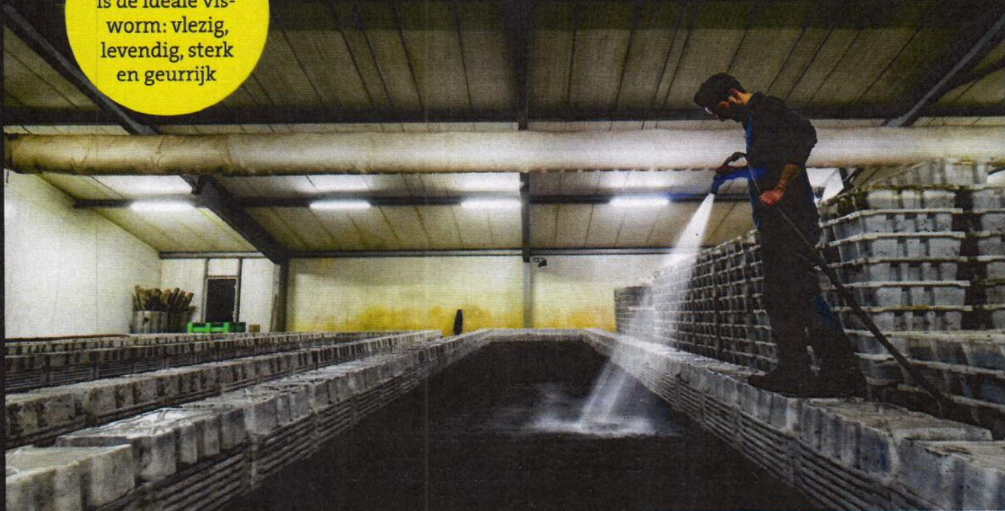
De ideale omstandigheden voor het kweken van wormen luisteren nauw.

De Dendro- beana veneta is de ideale vis- worm: vlezig, levendig, sterk en geurig